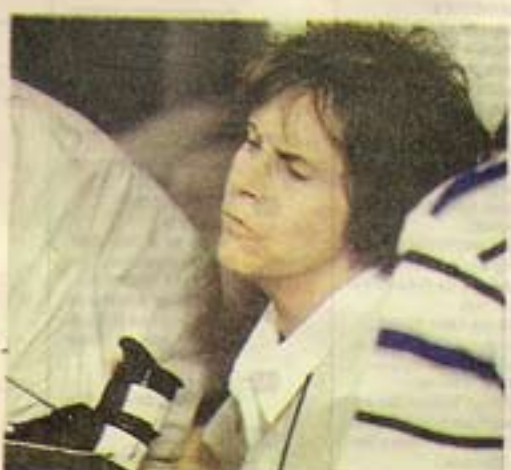
PROFESIONALISMO. María Luisa Bemberg frente a un aforado sueño hecho realidad.