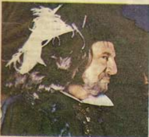
FELIZ RETORNO. Héctor Alterio volvió a su patria y caracteriza a un exquisito virrey.